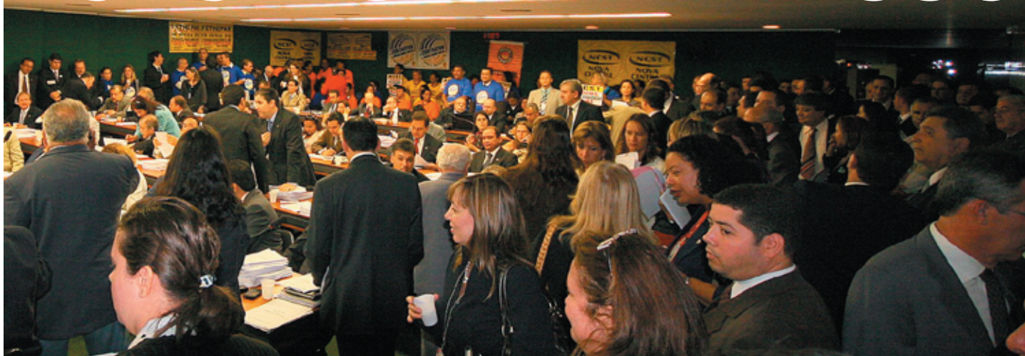
Com o aval da Comissão de Finanças e Tributação da Câmara, foi dado passo importante para o reconhecimento dos bingos. Na plenária, sindicalistas, trabalhadores, empresários e parlamentares.

A Comissão de Finanças e Tributação da Câmara aprovou no dia 18 de junho, em votação simbólica, a legalização dos bingos. Dos 31 deputados presentes, 5 fizeram questão de manifestar o voto contrário ao projeto. Agora a proposta será analisada pela Comissão de Constituição e Justiça (CCJ) e depois votada em plenário. Cálculos da Associação Brasileira dos Bingos (Abrabin) indicam que o funcionamento legal dos estabelecimentos vai proporcionar cerca de R$ 6 bilhões anuais em pagamento de impostos e R$ 12 bilhões em prêmios.